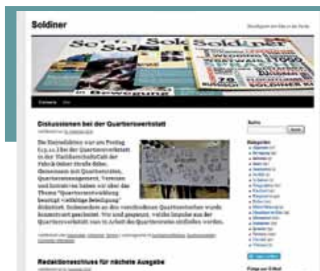
Foto links: Wer möchte, kann die Artikel des Soldiner auch auf dem Redaktionsblog nachlesen. Dort erscheinen auch aktuelle Informationen unserer Kooperationspartner. Außerdem wird Aktuelles über Vereine und Initiativen veröffentlicht, die bereits im gedruckten Heft vorgestellt wurden.

Um eine Kiezzeitung in Zukunft finanzieren zu können, muss über Einnahmen nachgedacht werden. Aber wenn Einnahmen durch Anzeigen im Heft, dann bitte Werbung für den Kiez. Das gibt auch für den Leser einen Mehrwert. Ziel könnte es sein, die Gewerbetreibenden aus dem Kiez zu unterstützen. Oder ein besonderer Themen- und Serviceteil kommt hinzu, für den der Leser dann einen Obolus bezahlt. Ein Möglichkeit wäre es auch, für alle Weddinger Kiezzeitungen eine gemeinsame Plattform zu gründen. Das könnte für Bewohner und Besucher interessant sein.