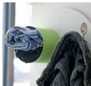
Foto links unten: Alicja Nagorko (links) und Sabina Bronszkowska stellen in der Leckerwissen-Küche in der Grüntaler Straße neuerdings auch Lampen und andere schöne Dinge her. Alles wird aus alten Verpackungen hergestellt. So werden aus Schraubgläsern zum Beispiel Lampen und aus alten Konservendosen praktische Erweiterungen für die Garderobe (Foto rechts).