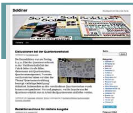
Foto links: Wer möchte, kann die Artikel des Soldiner auch auf dem Redaktionsblog nachlesen. Dort erscheinen auch aktuelle Informationen unserer Kooperationspartner. Außerdem wird Aktuelles über Vereine und Initiativen veröffentlicht, die bereits im gedruckten Heft vorgestellt wurden.

Um eine Kiezzeitung in Zukunft finanzieren zu können, muss über Einnahmen nachgedacht werden. Aber wenn Einnahmen durch Anzeigen im Heft, dann bitte Werbung für den Kiez. Das gibt auch für den Leser einen Mehrwert. Ziel könnte es sein, die Gewerbetreibenden aus dem Kiez zu unterstützen. Oder ein besonderer Themen- und Serviceteil kommt hinzu, für den der Leser dann einen Obolus bezahlt. Ein Möglichkeit wäre es auch, für alle Weddinger Kiezzeitungen eine gemeinsame Plattform zu gründen. Das könnte für Bewohner und Besucher interessant sein.