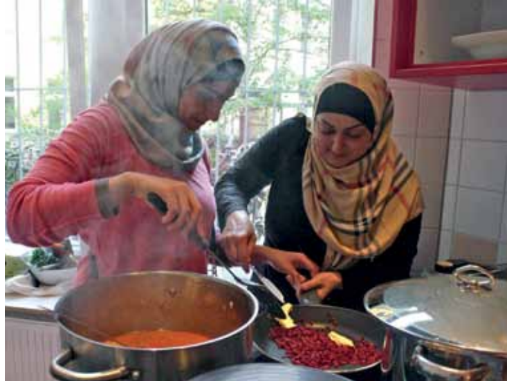
Gemeinsam kochen, gemeinsam basteln. Bei Kiez, Kids & Co. im Panke-Haus wird vor allem Gemeinschaft großgeschrieben. Das Projekt gibt Eltern und ihren Kindern Gelegenheit und Raum, zusammenzukommen und sich auszutauschen. Es ist ein Angebot von Eltern für Eltern.

Das Panke-Haus stellt der Elterninitiative die Räumlichkeiten kostenlos zur Verfügung. Der Austausch mit anderen liegt allen am Herzen. Für die Zukunft wünschen sich die Mütter langfristige und nachhaltige Projekte mit anderen soziokulturellen Einrichtungen und frei-